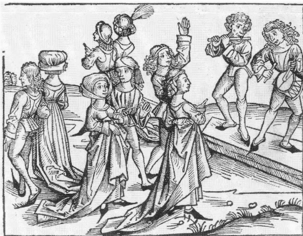
"Die verfluchten Tanzpaare". Houtsneede (van Albrecht Dürer?) in de Wereldkroniek van Hartman Schedel (Nürnberg, 1493), te zien in SCHWEINFURT.

In de Stads- en Athenaeumbibliotheek te Deventer werd al enige tijd gewerkt aan een on-line catalogus van de daar bewaarde middeleeuwse handschriften. Onlangs werd het eerste stadium afgesloten: korte beschrij-