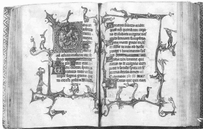
Fantastische drôleriën in de marge. Baltimore, Walters Art Gallery, Ms. W. 90, fol. 66v-67r. Te zien in LEUVEN.

MACCHI, Federico & Livio, Dizionario illustrato dello Legatura . Milano, Bonnard, 2002. 600 pp., ills., geb. € 260. Zeer rijke (maar ook dure) publicatie, met meer dan 1000 lemmata en o.m. een grote bibliografie, overzicht van alle bandenexposities sedert 1900, inventaris van prijsbanden in 222 Italiaanse bibliotheken, glossarium in Fra., Du., Eng., Lat.