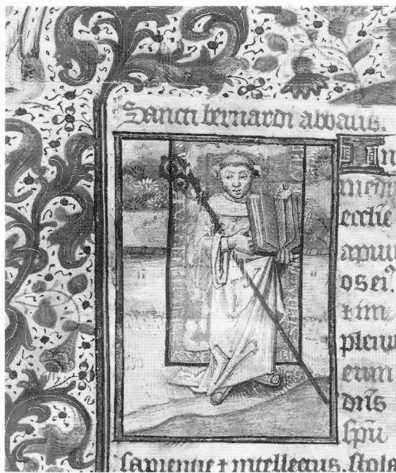
Bernardus van Clairvaux († 1153). Gehistorieerde initiaal in Cisterciënzermissaal uit Ter Doest, vóór 1476. Brugge, Grootseminarie, Ms. 49/18, fol. 302v. Te zien in BRUGGE.

OLDENBURG Landesbibliothek: Handel mit neuen Welten. Die Vereinigte Ostindische Compagnie der Niederlande 1602-1798 . 17 oktober – 30 november 2002. Presentatie uit de collecties van OLB. Met publ.